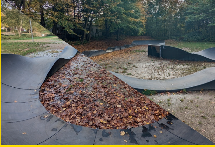
Pumptrack - Dietrichsdorf